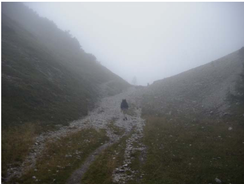
Gudl beim Aufstieg am 31. 8.